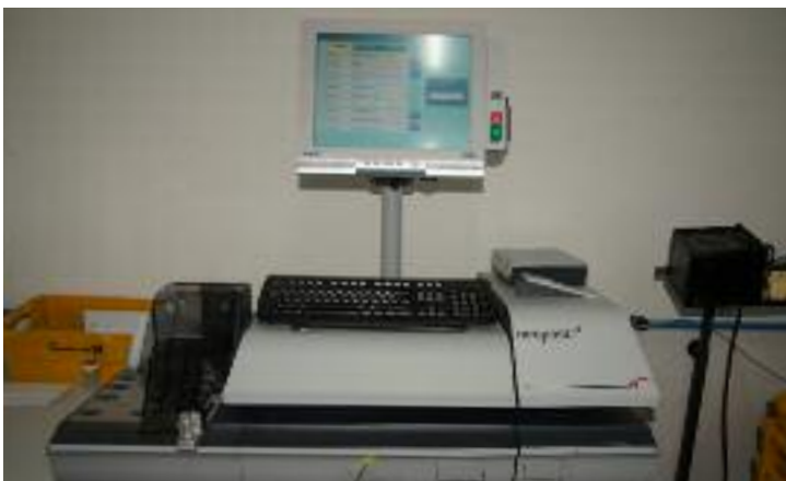
Die Frankiermaschine IS6000 von Neopost zum professionellen Frankieren ist Voraussetzung für die Postlizenz zum Rabattieren von Vollporto-Briefen.

Nagl Papierverarbeitung Tel. 0 89 / 69 79 87-0